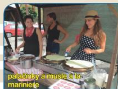
palačinky a mušle à la mariniera