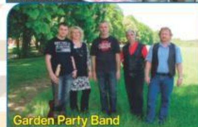
Garden Party Band